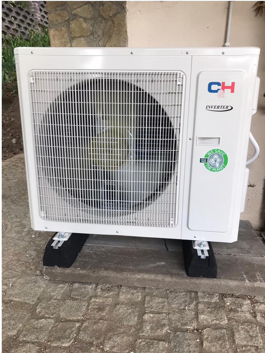
Inwerter zamontowany na podstawach tłumiących wszelkie wibracje, podczas pracy.