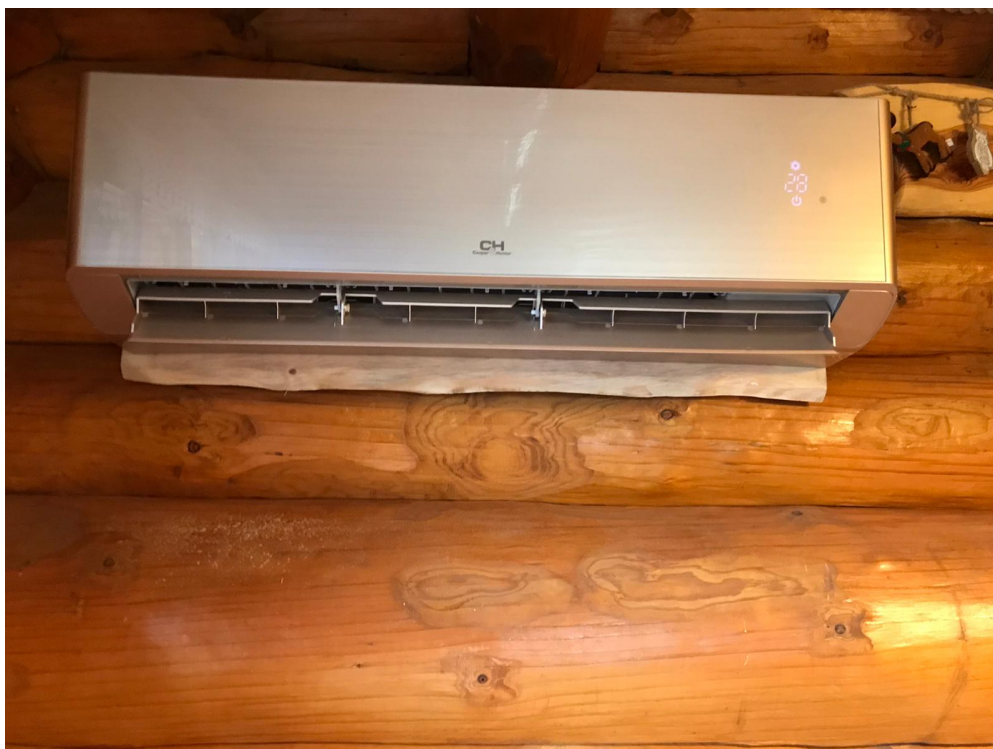
Obudowa parownika w kolorze złotym, dopasowana do kolorów wnętrza pomieszczenia.

Dzięki tej inwestycji, pomieszczenia najczęściej używane przez domowników, będą wystarczająco ciepłe zimą -30 °C na zewnątrz, przy znikomym spadku wydajności, zaś chłodne latem. Ekspozycja domu na stronę południową nasłonecznioną.